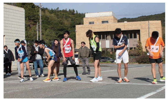
由岐支所前スタート

由岐支所前を発着点とした5区間12.3kmのコースで健脚を競い、西の地ダイナマイトチームが優勝を飾りました。