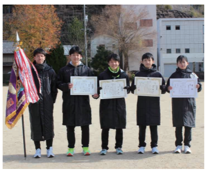
優勝した西の地ダイナマイトチーム