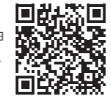
応募概要および申込方法はこちら→