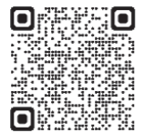
詳しくは「海上保安庁HP」をご覧ください→