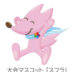
大会マスコット「スフラ」

30歳以上なら誰でも参加できる世界最大級の生涯スポーツの祭典「ワールドマスターズゲームズ2027関西」が、2027年5月、日本で初めて関西一円を舞台に開催されます。徳島県内では、カヌースラローム(那賀町)、ゴルフ(徳島市・鳴門市・阿波市・神山町)、ボウリング(徳島市・石井町)、トライアスロン・アクアスロン(美波町)、ウエイトリフティング(鳴門市)の5競技6種目が実施されます。このうち美波町では、トライアスロン・アクアスロンが開催されます。世界中のスポーツ愛好家と交流できる、またとない機会です。競技エントリーは2026年春開始予定。ぜひご参加ください。詳しくは「WMG2027」で検索、または右記二次元コードからご確認ください。