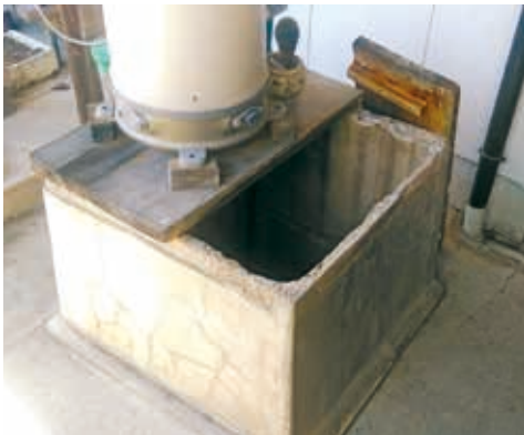
防災時の水源として注目される井戸

水池に関しては、既に緊急遮断弁を取り付け生活用水の確保を図っている。町内の井戸に関しては、現時点で把握できてはいないが、災害時の井戸活用も検討していく。