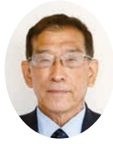
ひろし 博 議員 えびすの 戒野