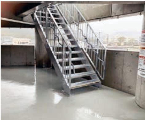
浸水する開口部からの雨

他県の事例を元に壁で囲ったものとしてほしいとの要望もあつたが施錠の日常管理問題があり、ビニールカーテン工事で風雨対策を施している。引き戸を設けることは建物構造に大きな変更を伴う