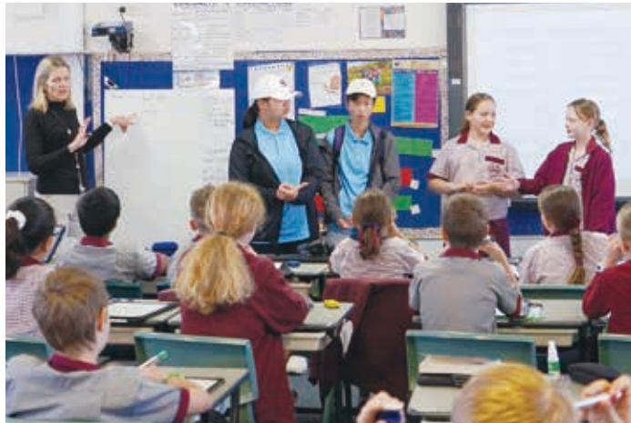
ケアンズ市小学生との交流

円安、人事異動、コロナの事情含め、子供には責任がない部分であり、1人でも多くの子供に学びの機会が与えられるよう検討すべき。企業版ふるさと納税の