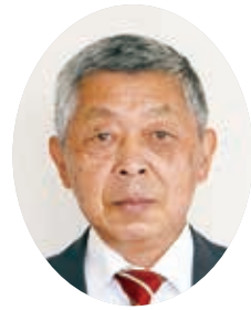
むこうやま あつひろ 向山 篤宏 議員