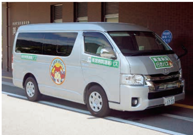
美波病院連絡バス

この質問については何度も受けてその都度改善している。今のところ2台で運行している中ではこれがベストである。高齢化する美波町の中で住民の人の足をどうするかは大きな課題。病院連絡バスだけでは限界がある。新たな公共交通的なものを設置することを考えていかないと難しい。全