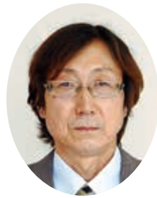
こ べ 部 正 博 議員