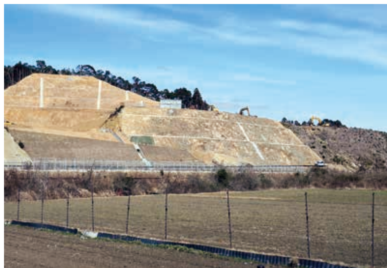
工事中の日和佐地区高台防災公園

仮設住宅の建設候補地として整備している。平成26年11月に実施した事前復興まちづくりに関する住民意向調査により、必要戸数約380戸を想定している。