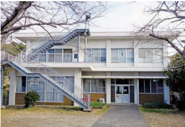
運営に青息吐息の東由岐公民館