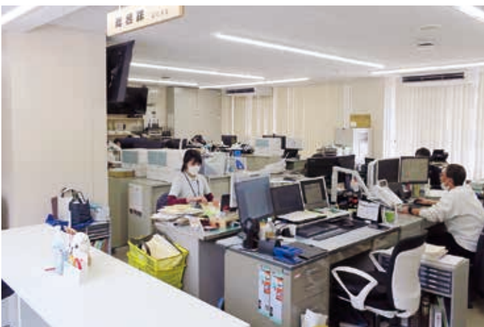
災害対応で総務課・消防防災課等が本庁舎2階へ移転

要望については、他地域の状況、優先順位等を踏まえ、公正に内容を精査し対応可能なものは、当初予算への計上を考えている。また、検討結果は各町内会へ回答する。