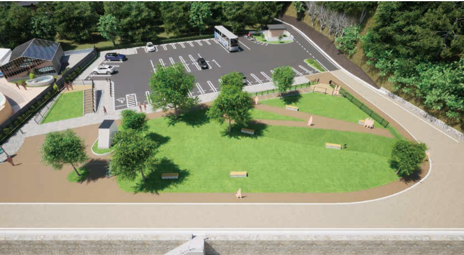
うみがめ荘跡地 再生イメージ