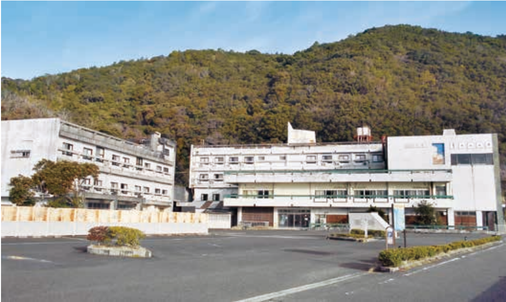
解体されるうみがめ荘