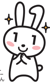
マイナンバー PRキャラクター マイナちゃん