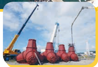
阿南市橘港大湊地区での消波ブロック製作状況