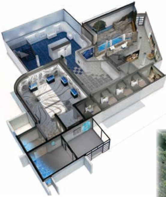
カレッタ リニューアルイメージパース

私たちの町がこれまで歩んできたうみがめと町民の歴史工事で、うみがめを通して自然との共生・環境保全を学ぶ。工事後は、子どもから大人が共に学び、伝える施設に