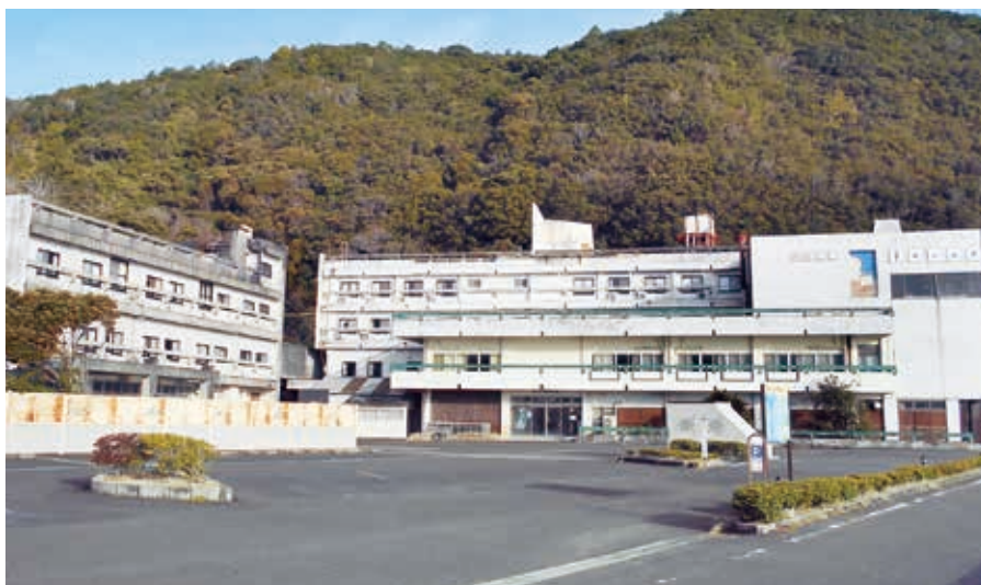
解体工事予定の「うみがめ荘」