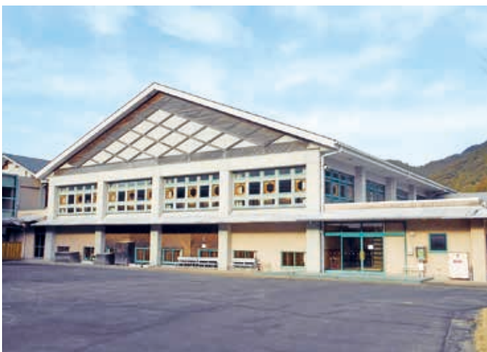
改修予定の「日和佐中学校体育館」