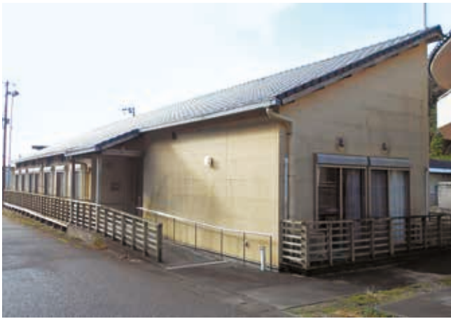
事業廃止の「やすらぎ」

内容 築21年を経過し、雨漏りが体育館内に複数カ所ある。それを改善改修する全面ふき替える工事。 契約方法 (指名競争入札) 契約金額 (5190万円) 契約相手 (葵建設株式会社)