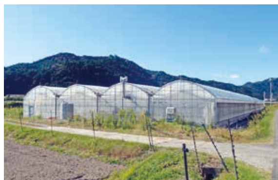
きゅうりハウス（西河内）

「きゅうり塾」があり、きゅうり経営をしたい方の勉強する場がある。今回、西河内のきゅうりハウスを使いたいという夫婦がいる。今年の10月からきゅうり塾で1年間きゅうり栽培、経営等を勉強してもらい、西河内のきゅうりハウスを使う計画になっている。