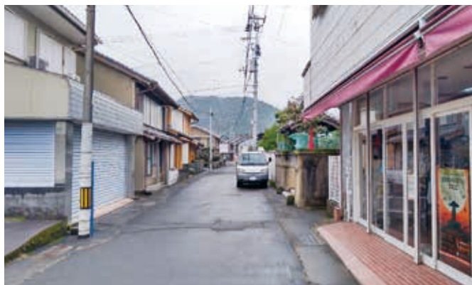
食料品店が無くなった日和佐浦