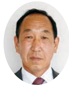
きたやま あさひこ 議員 北山 朝彦