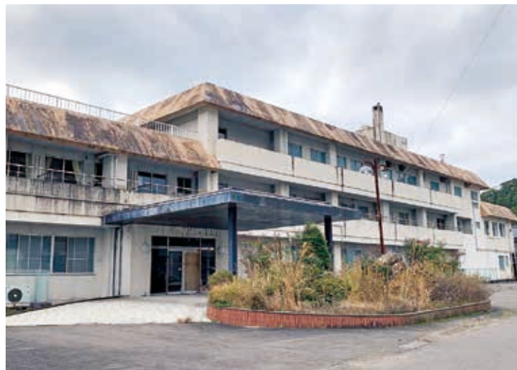
解体前の旧由岐病院