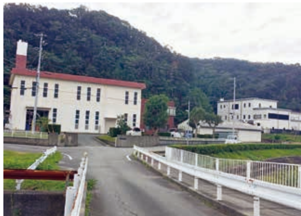
クリーンセンターと浄化センター（右）

し尿処理の「日和佐クリーンセンター」は34年経過、耐用年数は47年で新耐震基準は満たしている。1mの津波浸水区域だが高台移転の予定も、建て替えの予定もない。維持経