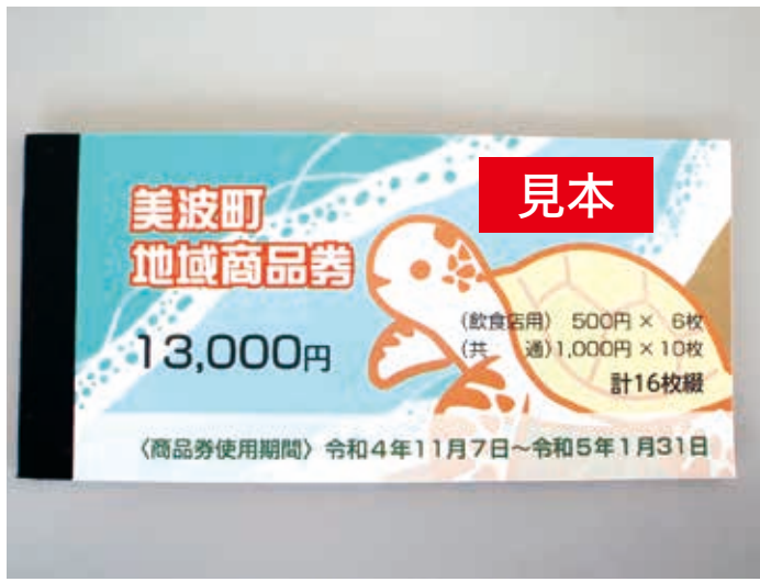
使用期限は1月31日までお忘れなく