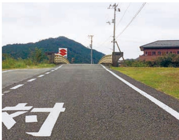
見通しのきかない嵐橋

うが約2億円安くなり、なお精査が必要。し尿処理について方向性を出し、検討を進める。