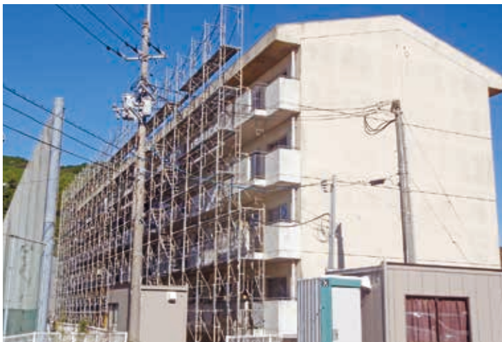
築37年の大久保団地