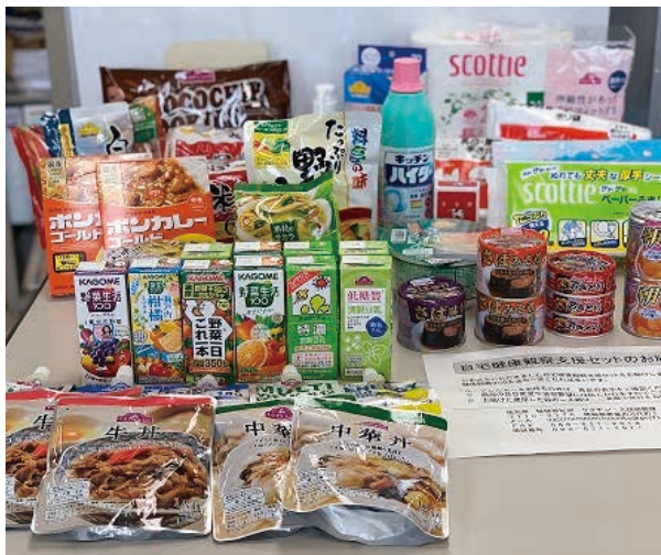
コロナ感染による自宅療養者への支援物資