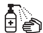
手指消毒用アルコール による消毒の励行

新型コロナワクチンの詳しい情報については、厚生労働省のホームページをご覧ください。