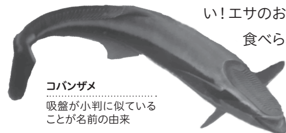
コバンザメ 吸盤が小判に似ていることが名前の由来

いるイメージがあるかと思いますが、自然界ではウミガメにコバンザメがくっついて いることもあります。館内1階にある水槽には体長60cmほどのコバンザメがタイマイと一緒にいます。コバンザメは、頭の上にある小判の形をした吸盤でタイマイのお腹にくっつき、エサが落ちてくると横からひょいと出てきてキャッチします。たまに両方がエサに食いつき、取り合いになることも…。ウミガメの体にくっつくことで移動も楽チン! 敵にも襲われにくい! エサのおこぼれが