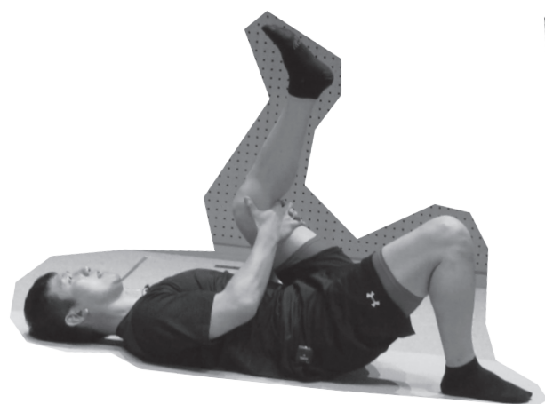
太ももから膝裏のストレッチ (呼吸を止めないで20秒)