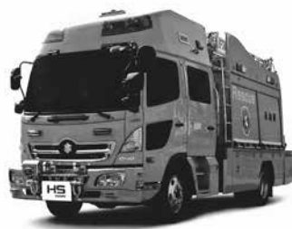
平成30年度購入予定 救助工作車(イメージ)