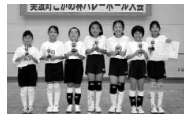
Dゾーン優勝：日和佐ファイターズ(B)