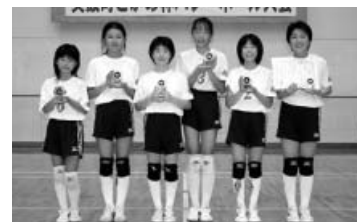
Cゾーン準優勝：日和佐ファイターズ(A)