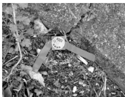
地籍調査で境界確定した杭