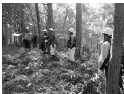
赤松字新発谷での地籍調査

(3) 現地の確認や測量のため、町職員や委託業者が現地に立ち入ることがあります。 ご理解、ご協力ください。