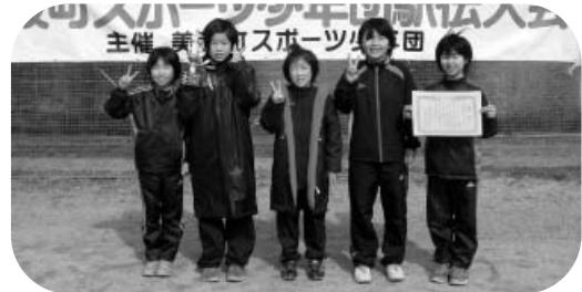
女子の部“準優勝”の由岐JVC-Aチーム