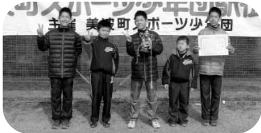
男子の部“優勝”の由岐少年野球部Aチーム