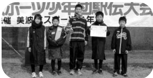
男子の部“第3位”の美波町SJ-Aチーム