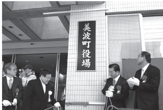
美波町誕生(開庁式)