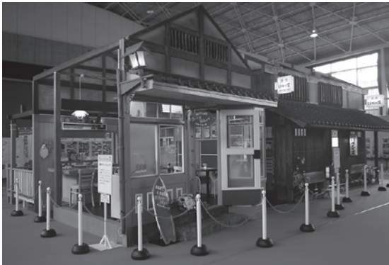
ウエルかめミュージアム開館