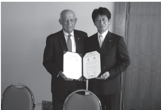
姉妹都市協定再締結(オーストラリア ケアンズ市)