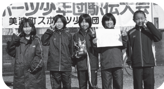
女子の部「優勝」の 由岐JVC-Aチーム