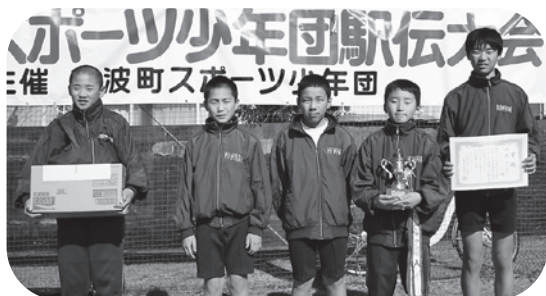
男子の部「優勝」の 日和佐バロンズ-Aチーム

優勝：日和佐バロンズ-A 準優勝：FC.YUIMAR 第3位：牟岐若潮クラブ-A