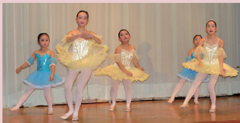
スズキバレエアカデミー