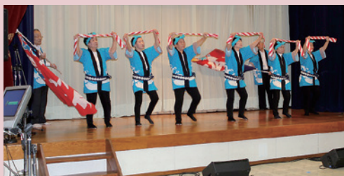
老人会民踊クラブ