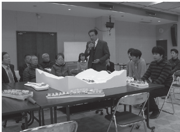
座談会の感想を話し合う

表彰式の後、入賞者がそれぞれ3分間程度、設計意図を話してから、地元町民を交えて座談会をおこないました。地元から「実際にできるのかなあ」と思っていたけど、話を聞いて、できるんだと思っ直した」という感想も。なんとかして実現したいと思います。