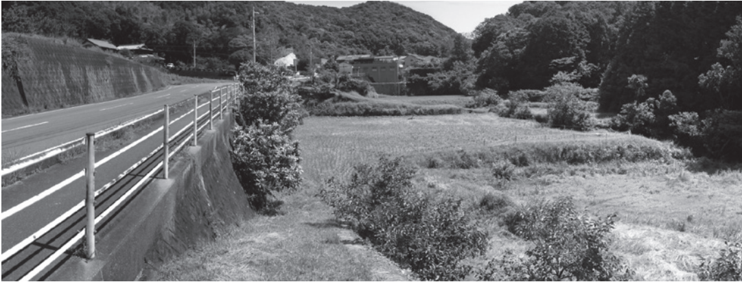
コンペ対象敷地全景