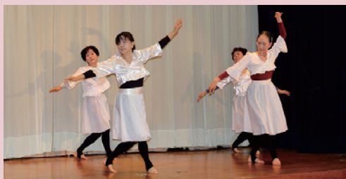
創作ダンスクラブ

舞台衣装に身を包んだ31組の出演者は、日舞やバレエ、カラオケ、コーラス、三味線、創作ダンスなど日頃の練習の成果を披露しました。