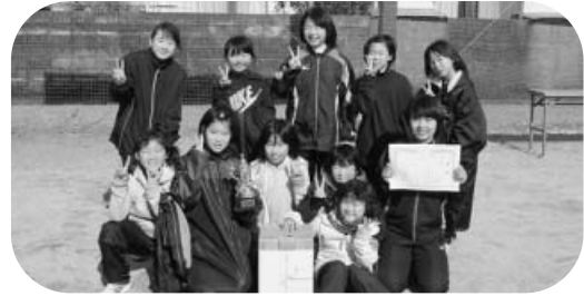
女子の部“優勝”の由岐J V C - Aチーム