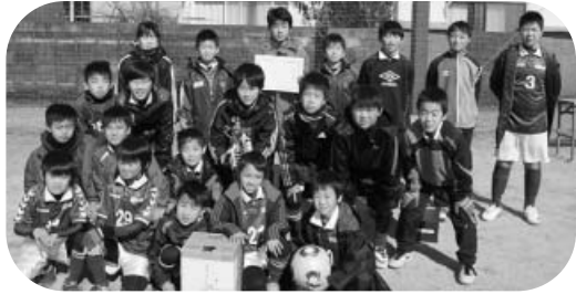
男子の部“優勝”の美波S J - Aチーム

優勝：由岐J V C - A 準優勝：日和佐ファイターズ - A 第3位：牟岐J V C