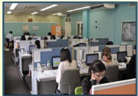
写真:コールセンターフロア