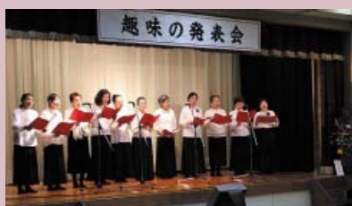
【日本抒情歌】うぐいすの会