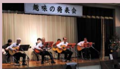
【ギター演奏】日和佐ギタークラブ

出演者は大正琴や三味線、ダンス、日舞、カラオケ、日本抒情歌など日頃の練習の成果を披露し、熱演・熱唱が続いたステージは観客を魅了していました。