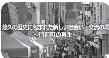
悠久の歴史に包まれた新しい出会い・交流の場 ～門前町の再生～