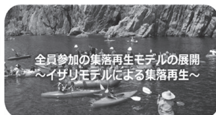
全員参加の集落再生モデルの展開 ～イザリモデルによる集落再生～