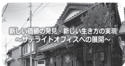
新しい価値の発見・新しい生き方の実現 ～サテライトオフィスへの展開～