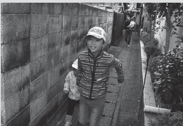
(写真左) 平時での活用も今後の課題。“見守り”のアイテムとして使えないかとのことから、今回は小学生にIoTタグを事前配布。避難時の位置情報を計測しました。(写真右) 役場本庁舎内に設置された本部の様子。

小さなタグを持っていれば、通信障害が起こった中でも位置情報が確認できるというこの仕組み。昨年、そして今年の実験結果はデータ化され、町内全域での本格運用を目指すだけでなく、訓練時の住民の避難経路を分析することで、今後の避難計画の改善・立案にも役立てていきます。