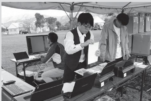
「失敗は許されない」とイベント開催直前まで真剣な面持ちで、何度もテストを繰り返していた学生さんたち。

この町で開発した技術が新しいビジネスとして育っていく。地域の教育機関と連携した人材育成も含め、今後もこのような例が次々と生まれることを期待したいと思います。