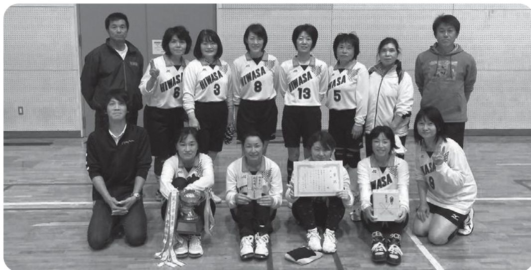
優勝した日和佐体協