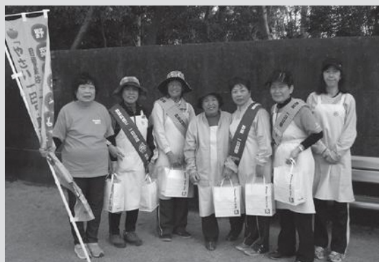
11月4日(日和佐町民運動会)