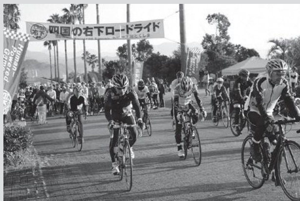
全国各地からの約600人がエントリー。有名選手も多数参加しました。