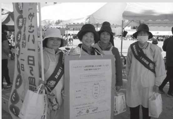
11月3日(由岐町民運動会)