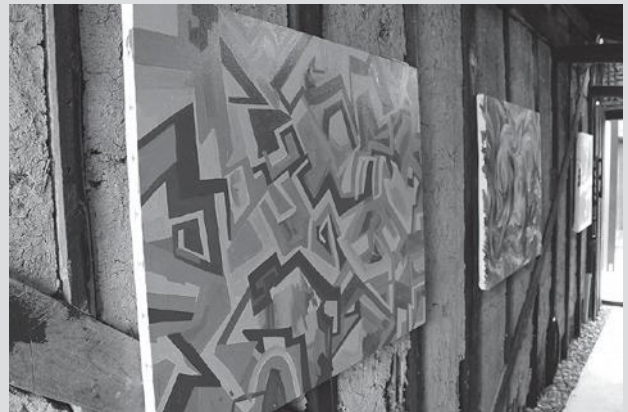
10/24～10/29に開催された個展「日和佐てん」の様子。施設内では一部作品の常設展示もあります。

「at Teramae」は、10月27日の第4回日和佐ハロウィンでもポスター、チラシの制作や、仮装コンテストの記念撮影などを担当。コンテスト参加者の記念写真は同所で無料配布されているそうです。