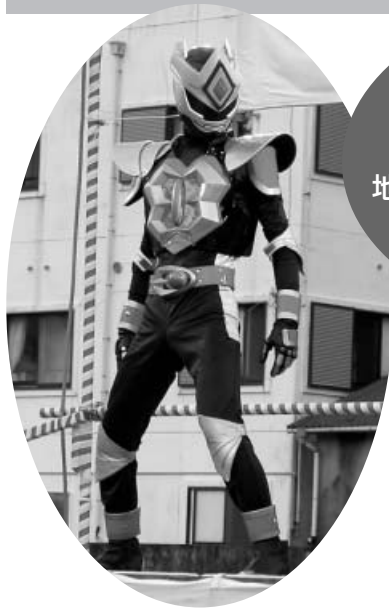
徳島の平和を乱すヤツは許さない！ 渦戦士の名にかけて

8月15日(水) お盆恒例の第28回ふるさと由岐まつりが開催されました。 地元連による阿波踊りや歌謡ショー、夜店など多くの町民や帰省客で賑わっていました。