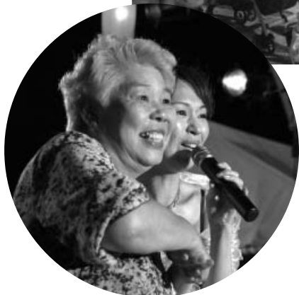
ヤットサー ヤットサー