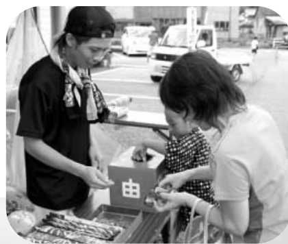
何が当たるかなあ

8月15日(水) お盆恒例の第28回ふるさと由岐まつりが開催されました。 地元連による阿波踊りや歌謡ショー、夜店など多くの町民や帰省客で賑わっていました。