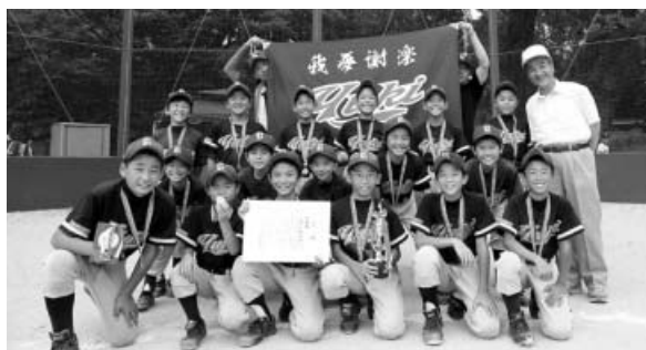
準優勝の由岐少年野球部

第1回少年野球美波大会が、8月4日～11日までの3日間、日和佐グラウンド外町内3グラウンドで24チームが集まり開催され、優勝は大野城山スポーツ少年団(阿南市)、準優勝には由岐少年野球部が輝きました。