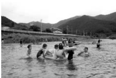
川遊びにみんな夢中!

毎年恒例の「第12回清流 日和佐川で自然を楽しもう！」(町観光協会主催)が8月5日(日)に開催されました。当日は、あいにくの空模様となりましたが、町内外から163名の参加者があり、会場となった西河内永田橋河原では、水中宝さがしやあゆのつかみどり、カヤック体験、川の生き物観察会など多彩なイベントが行われ、参加した子ども達は楽しいひとときを過ごしていました。