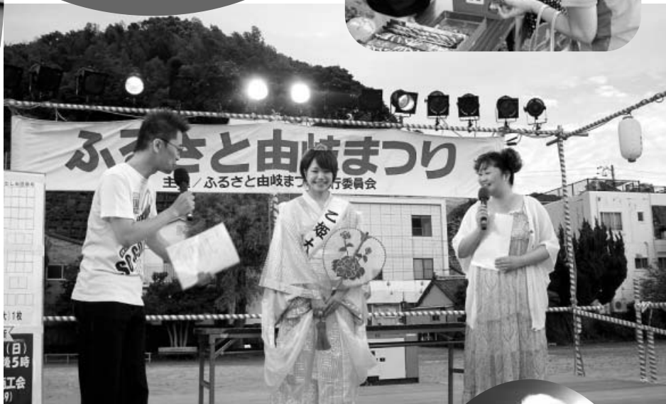
乙姫大使もまつりのために駆けつけました