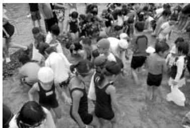
人・人・人…あゆのつかみどり