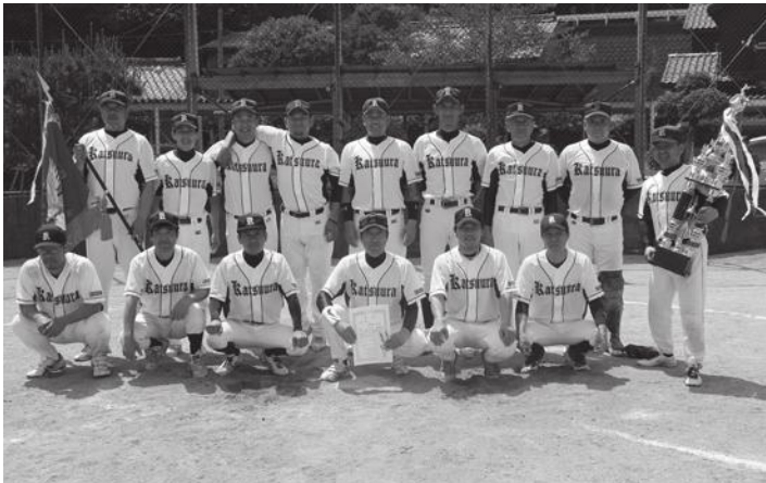
優勝した勝浦クラブ