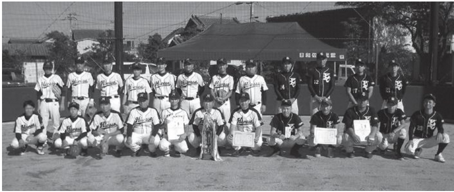
左：優勝・日和佐体協、右：準優勝・海部クラブ