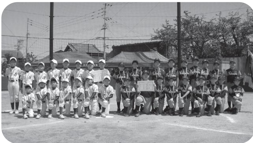
準優勝：坂野ベアーズ(左) 優勝：中野島スポーツ少年団(右)