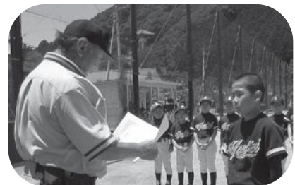
海南・由岐クラブ