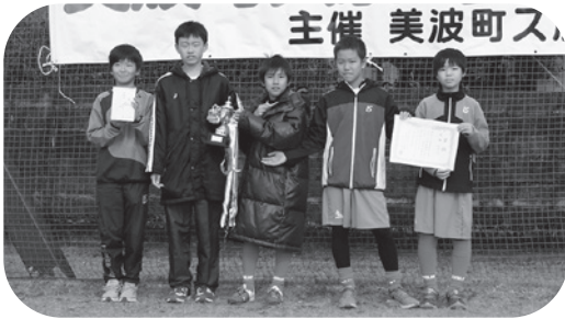
男子の部で優勝したFC.YUIMAR-A

優勝：FC.YUIMAR-A 準優勝：日和佐バロンズ-A 第3位：FC.YUIMAR-B