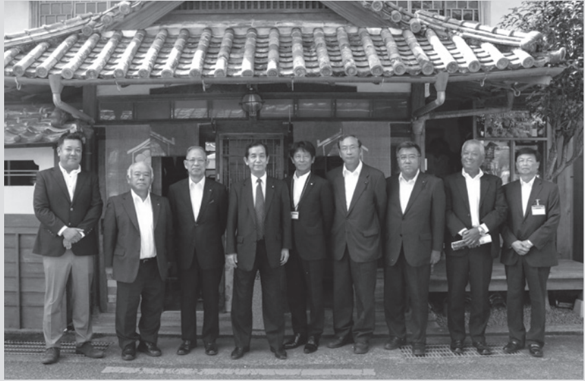
山本地方創生担当大臣が美波町を視察訪問

第二次安倍内閣が掲げる主要な政策となっており、内閣府特命担当大臣(地方創生、規制改革)を定め、国を挙げた取り組みとなっています。現任の地方創生担当山本幸三大臣は2016年9月に、地方創生の先進事例視察のため美波町を訪れました。