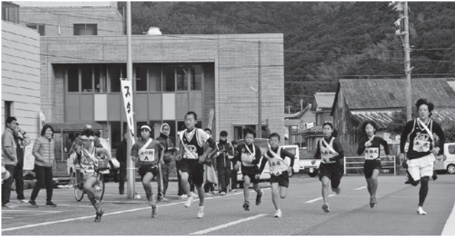
由岐支所前スタート

新春の風物詩、恒例の由岐駅伝競走大会が、平成29年1月2日(月)由岐青年会の主催で開催されました。由岐支所前を発着点とした5区間12.3kmのコースで健脚を競い合い、西の地Aチームが終始安定した走りで20回目の地区優勝を飾りました。