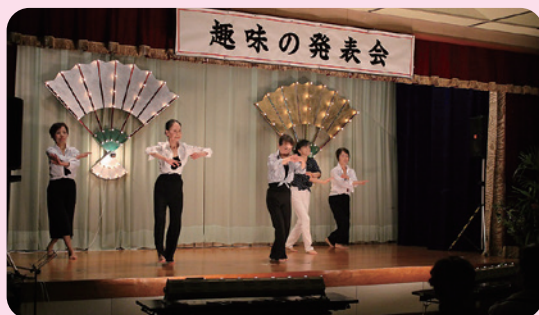
創作ダンスクラブ

舞台衣装に身を包んだ出演者は、日舞や民踊、カラオケ、コーラス、三味線、創作ダンスなど日頃の練習の成果を披露しました。