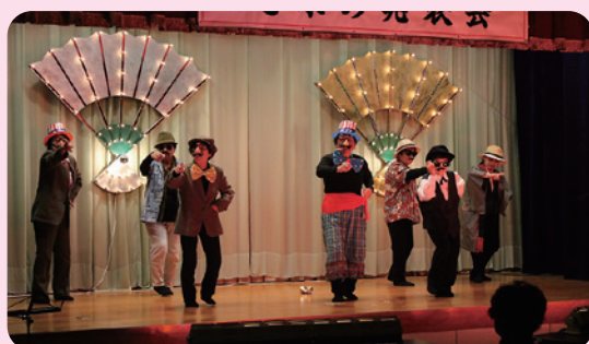
老人会民踊クラブ