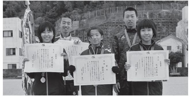
優勝西の地Aチーム