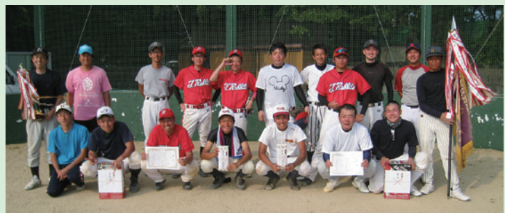
優勝した赤松公民館チームと準優勝した東町公民館チーム