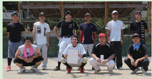
準優勝した木岐Aチーム