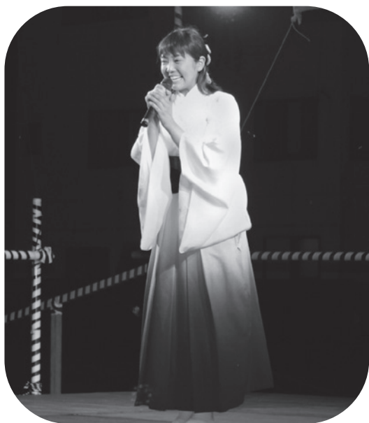
羽山みずき歌謡ショー