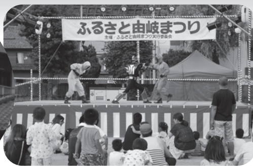
保育士ヒーローブレイクショー