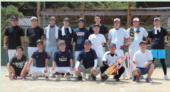
優勝した西由岐チーム