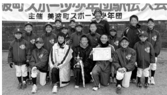
男子の部で優勝した由岐少年野球部

【女子の部】 優勝：牟岐JVC 準優勝：日和佐ファイターズA 第3位：由岐JVC