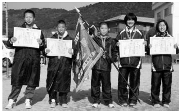
優勝 西の地Aチーム