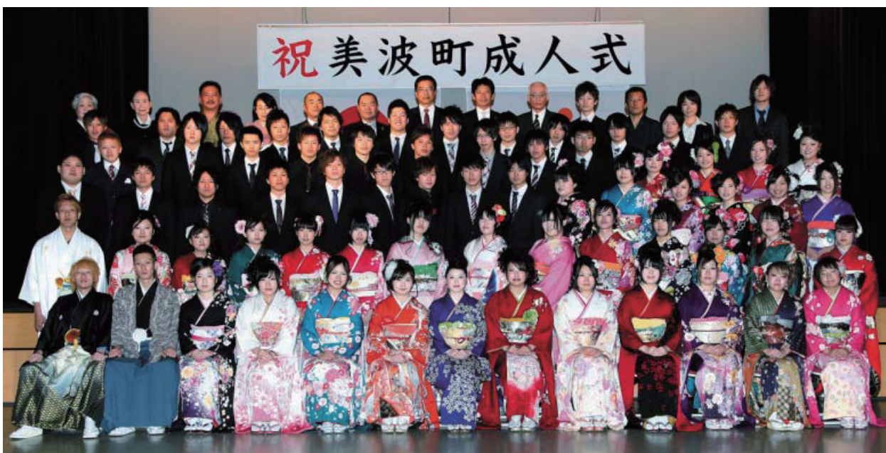
広報紙「みなみ」1月号の記事の中で白黒での掲載でしたので、再度掲載させていただきました。