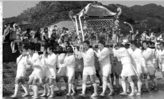
西由岐八幡秋季例祭