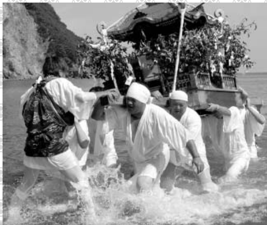
阿部宮内神社秋季例祭