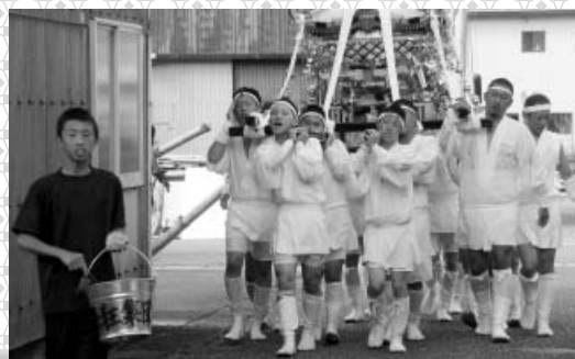
西の地岡崎神社秋季例祭