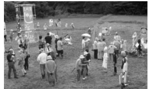
昨年のコンテスト風景

《応募要領》 大きさ・形・材料などは、自由です。応募期間は、9月16日(金)まで。作成できた人は、電話連絡ください。頂きにお伺いします。(美波町外の方は、お手数ですが、ご持参ください。)