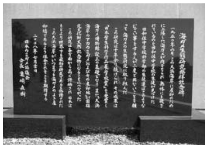
海ガメ生態研究発祥記念碑

この夏61歳になる1950年8月13日生まれのオスのアカウミガメです。生年月日の確かなアカウミガメでは、国内最年長で日々長寿記録を更新中です。