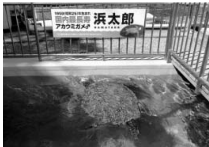
カレット屋外プール