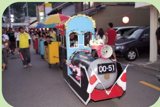
日和佐うみがめまつりでは、ジャンボSLも運行され子ども達に大人気でした。