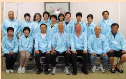
日和佐地区民生委員児童委員の皆さん