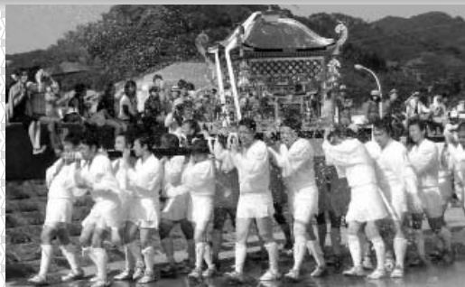
西由岐八幡秋季例祭