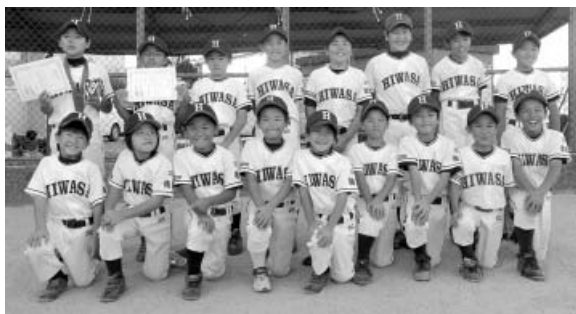
準優勝の日和佐バロンズ