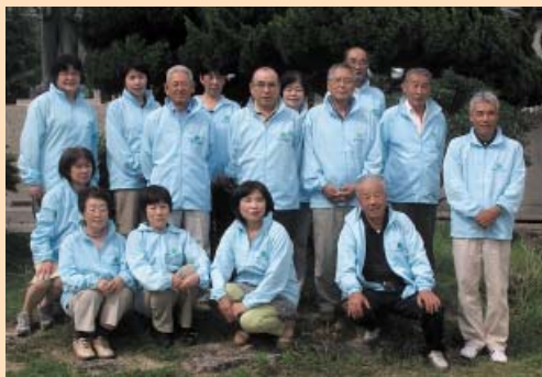
由岐地区民生委員児童委員の皆さん

個人の秘密は厳守されますので、日常生活で何か困ったことや悩みごとがありましたら、気軽にご相談ください。