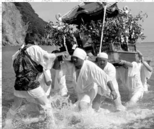
阿部宮内神社秋季例祭