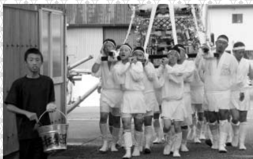
西の地岡崎神社秋季例祭