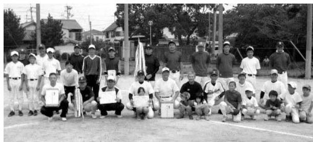
優勝した桜町公民館と準優勝した戎町公民館