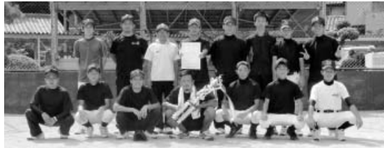
優勝した 西の地チーム