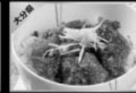
津久見ひゅうが井