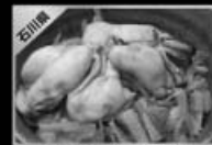
能登牡蠣がっかけ丼