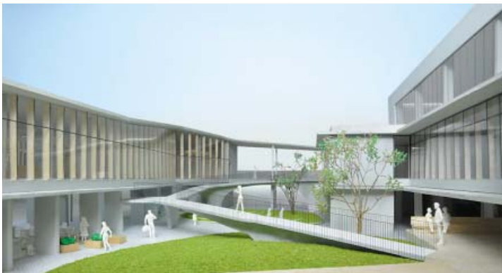
1階正面ピロティから中庭を見たイメージ