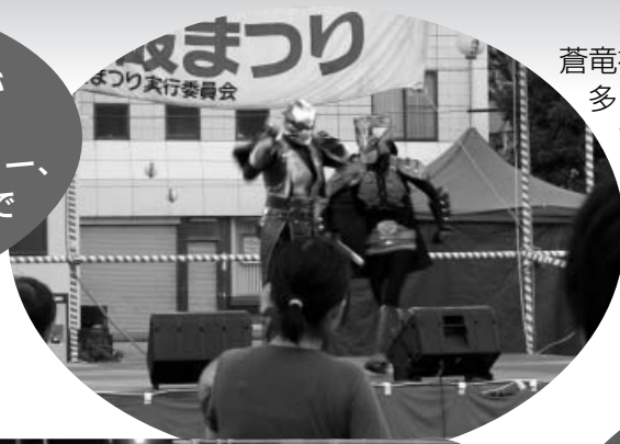
蒼竜神マヴェルショーは多くの子ども達を白熱させました

8月15日(金) お盆恒例の第30回ふるさと由岐まつりが開催されました。地元連による阿波踊りや歌謡ショー、夜店など多くの町民や帰省客で賑わっていました。