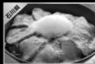
ローストビーフ丼