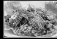
ふわふわイカと阿波尾鶏の井