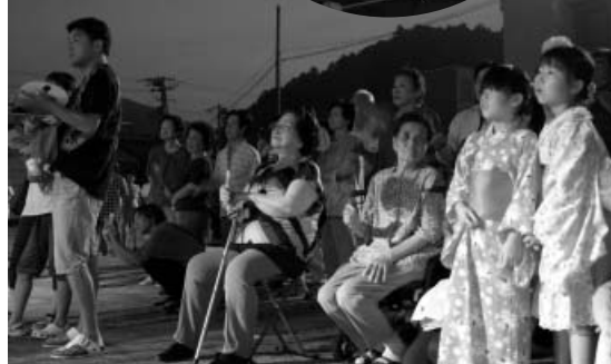
プロの歌声に聞き入る観客の皆さん