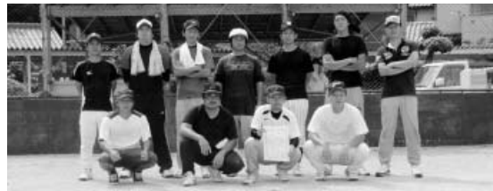
準優勝した西由岐チーム