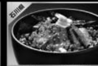
能登牛ロースト鉄火丼