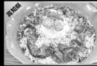
安芸市ちりめん井