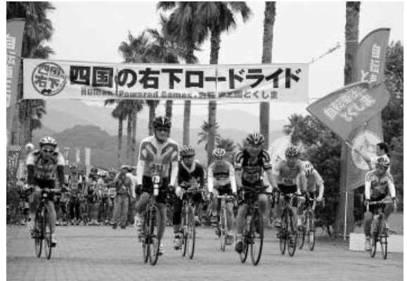
「四国の右下」ロードライドイベント実行委員会

なお、大会当日沿道で応援いただける方には応援用小旗を用意しております。お気軽に事務局までお問い合わせください。