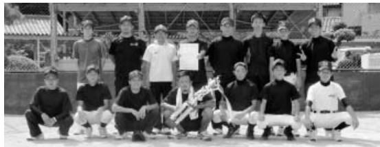
優勝した西の地チーム