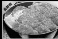
鞠ヶ根ソースかつ丼