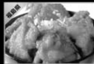
会津地鶏からあげ丼