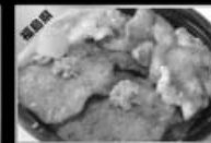
伊達の牛タン 鶏とろ焼き丼