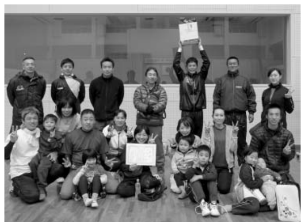
優勝した桜町公民館の皆さん