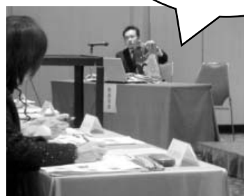
コンテスト発表の様子