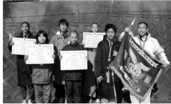
優勝した木岐チーム