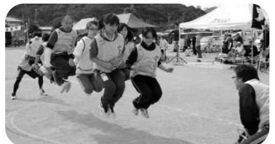
タイミングよく、はいっ！ジャンプ！