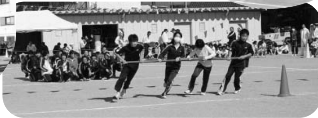
4人で力をあわせて