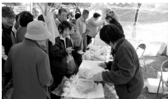
冷凍マグロ等販売

早朝からのアオリイカ釣り大会をはじめ、会場では、冷凍マグロやアオリイカの販売、ミニSL、全日本縁台将棋大会、ステージでは〇×クイズ、菓子・野菜等投げなどのイベントが行われ来場者を楽しませていました。また、各出店ブースには新鮮な海の幸、山の幸を求めて早くから大勢の人で賑わっていました。