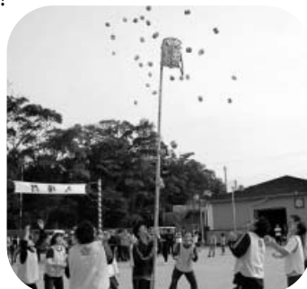
狙いを定めて、それっ！