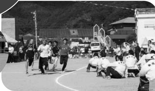
スタートダッシュ