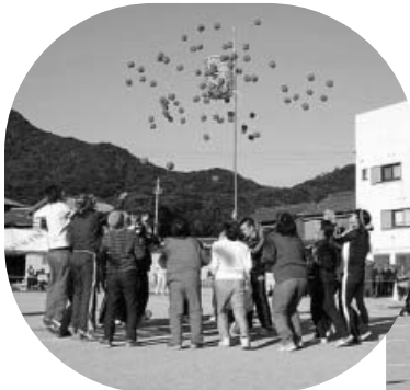
どのくらい入ったかな