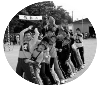
落とさず慎重に、後ろに送って