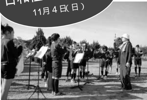
鼓笛隊の演奏で運動会が始まります！