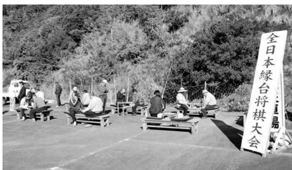
全日本縁台将棋大会