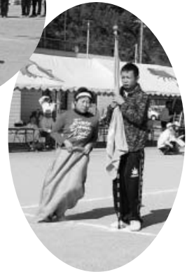
◀ すり足でがんばって