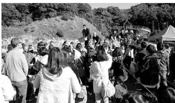
菓子・野菜等投げ