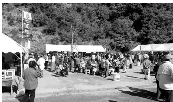
賑わいをみせた出店コーナー