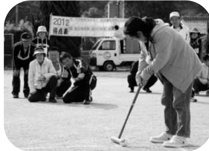
もうちょっと右、左、...