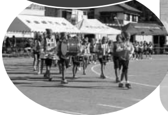
由岐小学校鼓笛隊