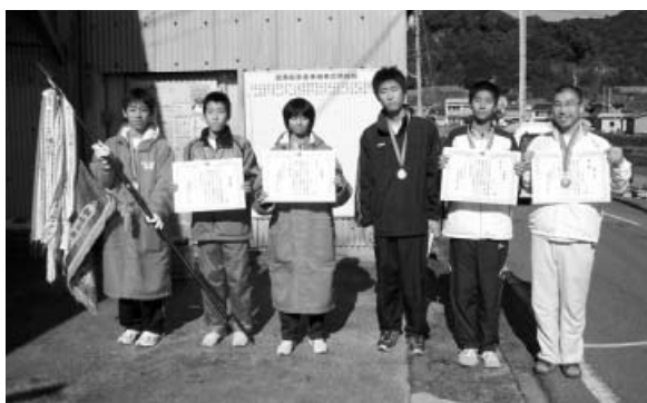
優勝した木岐チーム

第47回大会の今年も、阿部宮内神社前から木岐漁協前までの6区間17.1kmのコースで健脚を競い合い、5チームのランナーによる好レースが展開されました。