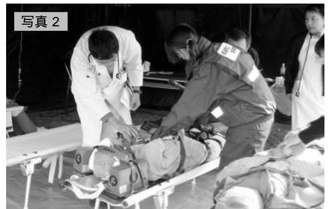
医療救護所には、自動車に閉じ込められた患者さん、倒壊した家屋から救出された患者さん(ダミー人形)が運ばれた。トリアージは赤。