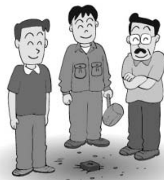
— 境界杭設置 —

— 地籍調査！（あなたの土地を再確認）子や孫に く 悔いを残さず くい 杭残そう！ —