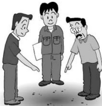
— 境界確認 —

赤松字新発口、港町字西及び字東、西由岐字西及び字東、西の地字西地及び東地地区及び隣接地の土地所有者の皆様には、日程等が決まりましたら、ご通知させていただきますので、よろしくお願いたします。