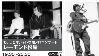
ちょっとオシャレな懐メロコンサート レーモンド松屋