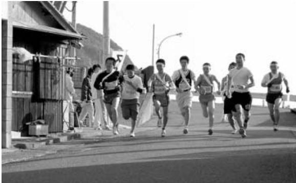
阿部宮内神社前スタート

新春の風物詩、恒例の由岐駅伝競走大会が、平成22年1月2日(土) 由岐青年会の主催で開催されました。第49回大会の今年は、阿部宮内神社前から木岐漁協前までの6区間17.1kmのコースで健脚を競い合い、好レースが展開されました。レース結果は、木岐チームが優勝し、一昨年、昨年に引き続き3連覇を達成しました。