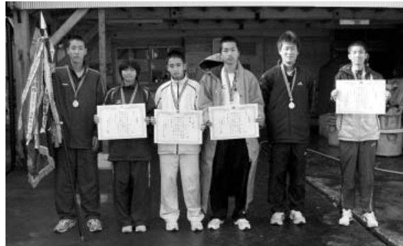
優勝(3連覇)した木岐チーム