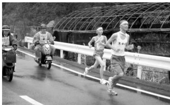
白熱のデッドヒート