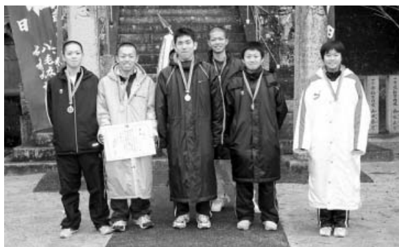
大会2連覇の東由岐Aチーム

新春の風物詩、恒例の由岐駅伝大会が、1月2日(火)に由岐青年会の主催で開催されました。第46回大会の今年も、木岐漁協前から阿部宮内神社までの6区間17.1kmのコースで健脚を競い合い、4地区6チームの参加のもと好レースが展開されました。レースの結果は、東由岐Aチームが昨年に引き続き2連覇しました。