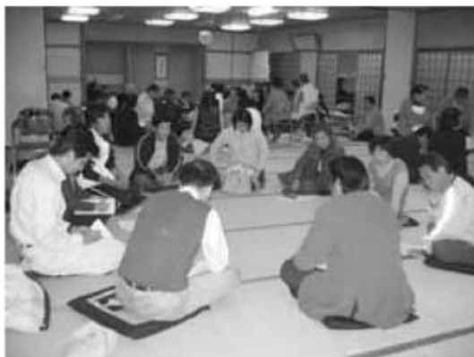
美波町の人権課題は？

そのときの美波町の人権課題についてのアンケートの結果と感想(一部)をご紹介します。