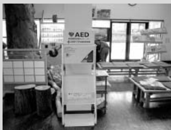
道の駅日和佐物産館

AED（自動体外式除細動器） 突然心臓停止状態に陥ったとき、正常な状態に戻す医療機器です。電源を入れると音声で操作が指示され、救助者がそれに従って除細動（要救助者の心臓に電気ショックを与えること）を行います。自動的に心電図を診断し、電気ショックを与える必要があるかどうかを判断するため、医療の知識がない一般の方でも音声ガイダンスに沿った簡単な操作で救命措置ができます。