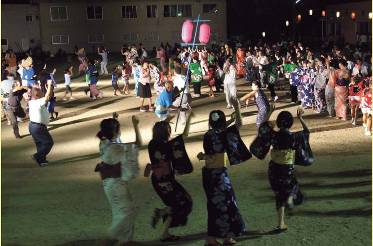
ふるさと由岐まつり 8月15日