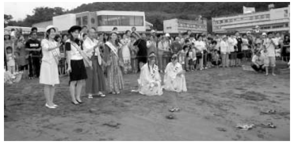
乙姫大使や招待レディによるうみがめ放流

7月21日(土)、第44回日和佐うみがめまつりが開催されました。台風のため1週間延期して行われ、当日も途中から雨が降り出すあいにくの天気でしたが、龍宮パレードや阿波踊り・大道芸・花火など多くのイベントが行われました。