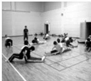
コ - ディショニングトレ - ニングの様子

8月3日(金)、日和佐総合体育館で、町体育指導委員会、町体育協会、町スポ - ツ少年団の役員や指導者、計18名が集まり、コ - ディショニングトレ - ニング 効果的なストレッチ技法などの実技研修と美波町の抱えるスポ - ツ環境の課題について話し合いをしました。今回のような組織や競技種目の枠を越えて、スポ - ツ関係者が集って研修会を実施したのは初めてのことであり、とても有意義な研修会となりました。