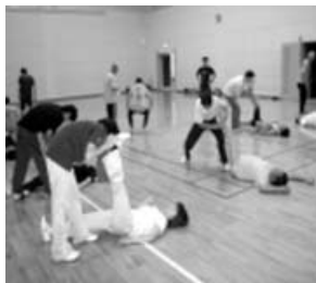
PNFストレッチの様子