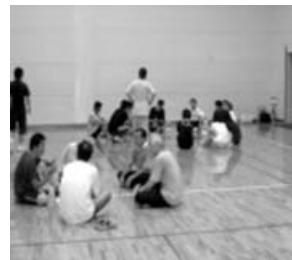
グル - プディスカッションの様子

子どもの笑顔を育むために、楽しいスポ - ツ活動の充実のために、大人の力を発揮しましょう