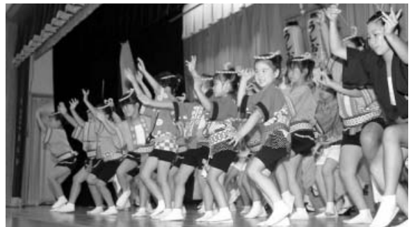
多くの連が阿波踊りを披露しました