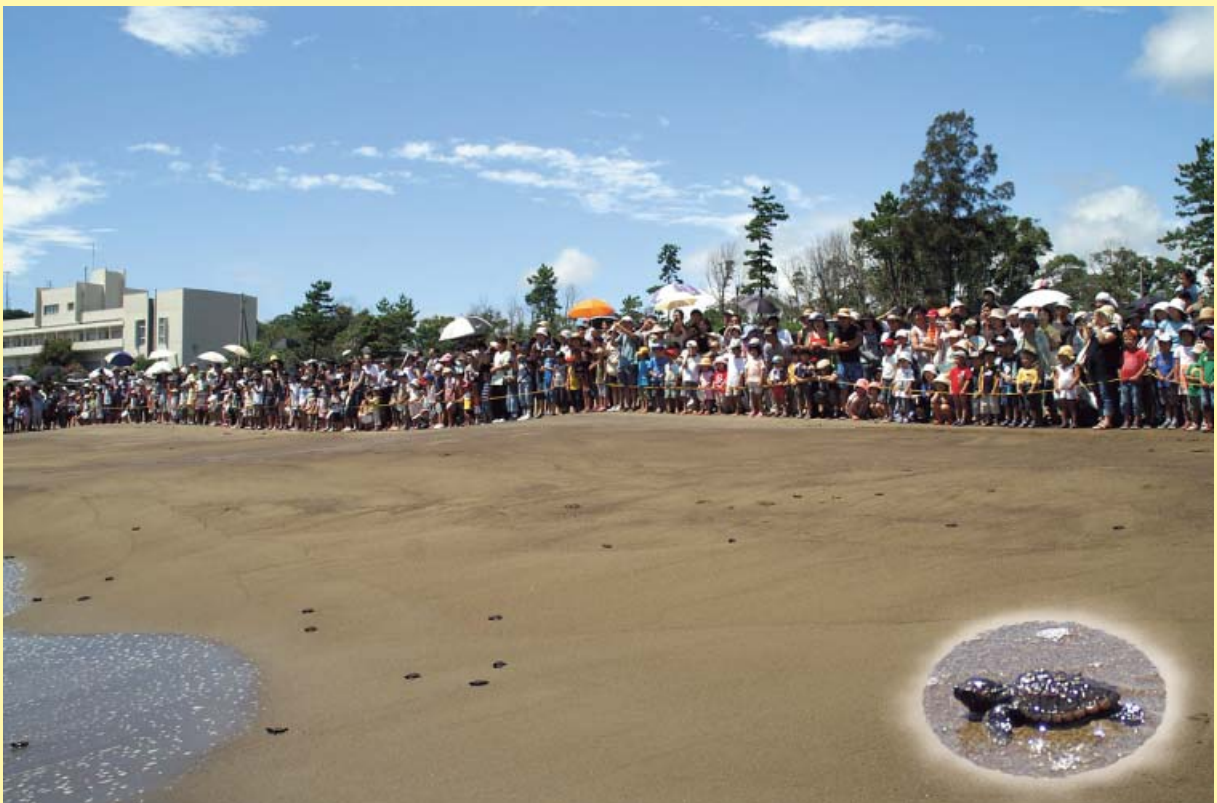
子がめ放流まつり 8月13・14日