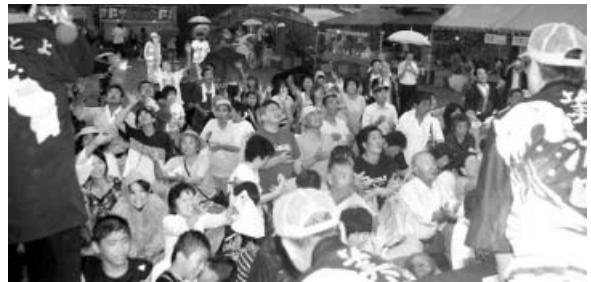
雨の中でももち投げは大盛況