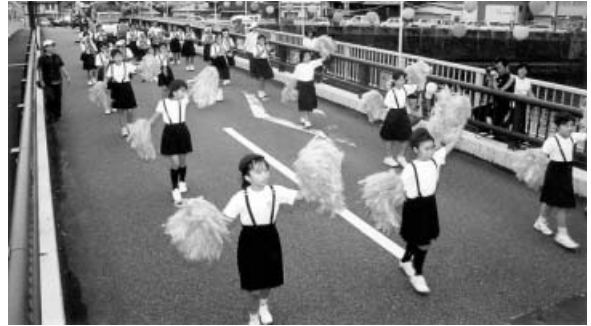
パレードを盛りあげた日和佐小学校スクールバンド