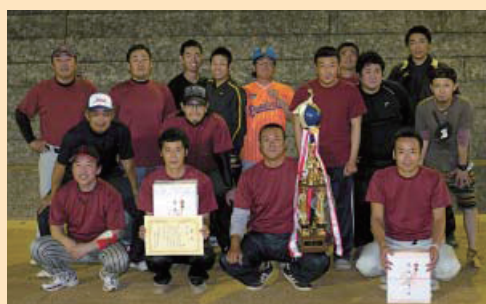
優勝した桜町公民館