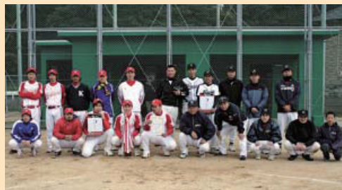
優勝した由岐クラブ(左) 準優勝した日和佐体協野球部(右)