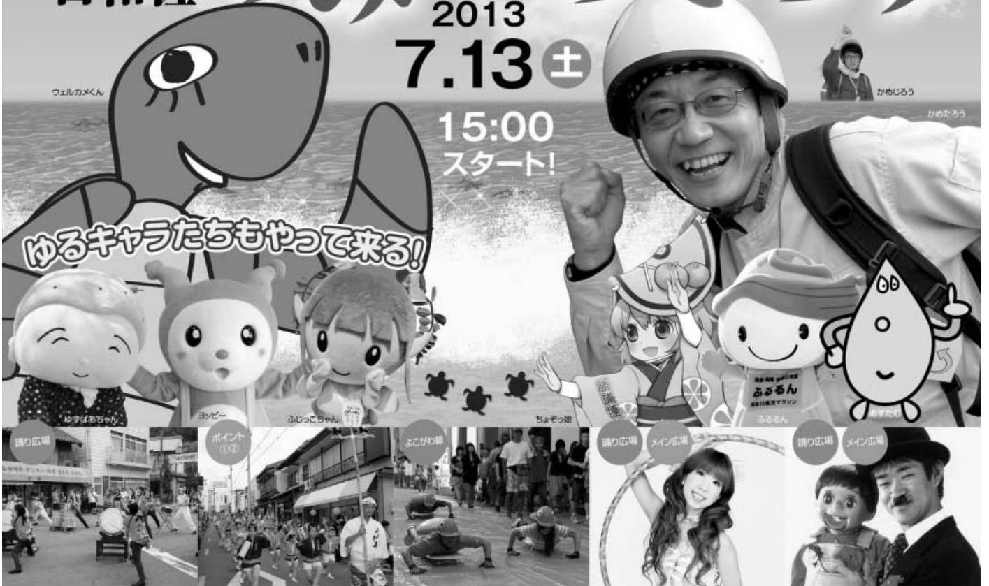
オープニングイベント 歓迎太鼓