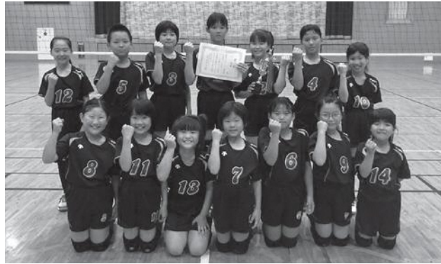
優勝した日和佐ファイターズ

7月6日(土)に行われた、美波町こがめ杯Aゾーンにおいて、日和佐ファイターズが優勝しました。